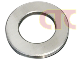
Metric Stainless Steel